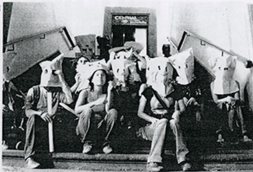
ULTIMO DIA EN LA CENTRAL DEL PUEBLO