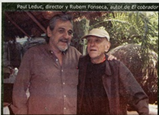
Paul Leduc, director y Rubem Fonseca, autor de El cobrador

"¡Yo también me quedé con las ganas de ver El Violín!