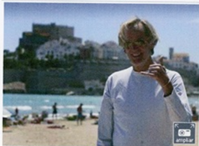
El actor Peter Fonda

Un hombre se quita el reloj y lo lanza al viento, lejos de la cámara, antes de arrancar una Harley Davidson. Estamos a finales de los sesenta, ese hombre se llama Peter Fonda (Nueva York, 1940), tiene 27 años y está actuando sólo a medias. Quiere vivir libre, sin condiciones, "tanto en la ficción como en la realidad", recuerda. Cuarenta años y más de 60 rodajes después, el legendario Capitán América, protagonista de Easy rider , hijo del también actor Henry Fonda y hermano de Jane, ya no tiene miedo a los horarios. Y contesta puntual, con un sonoro "sí, estoy listo" en su casa de Los Ángeles, donde descansa leyendo guiones. Como el que hace dos años le enviaron los productores de Cobrador: In God We Trust , largometraje del brasileño Paul Leduc que se estrena hoy en Madrid.