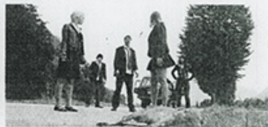
4 TERROR. MORIRÁS EN TRES DÍAS.