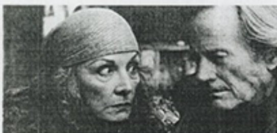
1 DRAMA. EL COBRADOR: IN GOD WE TRUST.