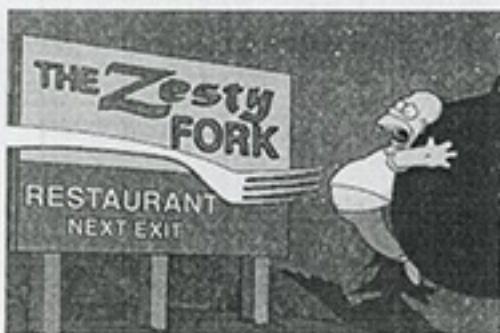
> Homer Simpson en situación apurada.

Matt Groening y su gente han tenido a bien librarnos del socorrido e irritante Los Simpson en... para evitar la descontextualización de la franquicia, como es costumbre cada vez que Hollywood (y no sólo) hinca el diente a un serial televisivo de éxito. Bien al contrario Los Simpson. La película es, por obvio que resulte, una cinta sobre el clan amarillo de Springfield sin aditivos distorsionantes.