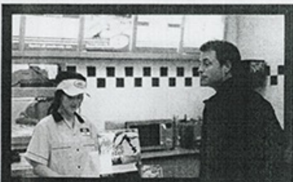
"Fast Food Nation" (Manga Films, agosto)