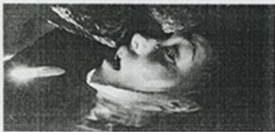
2 THRILLER. TURISTAS.