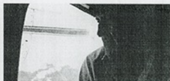
3 DOCUMENTAL. COCALERO.

2 A PRIORI, BRASIL. PARANCE un destino idílico para unas buenas vacaciones. La belleza exuberante de sus playas (y de los propios habitantes del país) es un espléndido reclamo para los turistas, pero, cuando se está lejos de casa, todo es posible. Alex, su hermana Bea y Amy, la mejor amiga de ésta, parten hacia el país de la samba y la caipirinha en su primera estancia en el extranjero. El accidente del autobús en el que viajan les deja tirados en mitad de la jungla, donde descubrirán lo que significa la palabra terror. «Estaba interesado en examinar los miedos de los norteamericanos al viajar al extranjero y cómo un impulsivo sentimiento juvenil de invulnerabilidad podía poner en peligro sus vidas», confiesa el director, John Stockwell. El cinasta vivió una situación parecida en Perú después del rodaje de Inmersión letal , que le ha servido de inspiración para desarrollar la sensación de impotencia de los personajes.