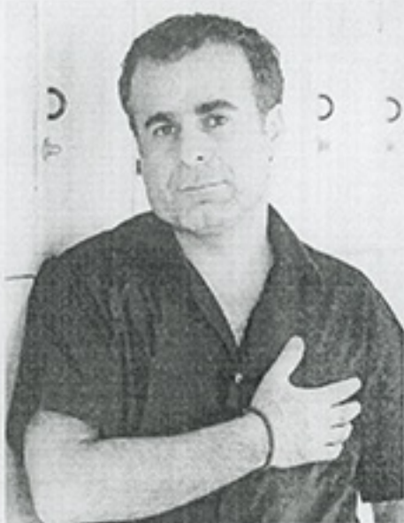
El director Bahman Ghobadi, en su reciente visita a Madrid

—La película quiere ser un homenaje a Mozart. ¿Qué le inspiró? —Cuando repasaba sus obras, me di cuenta de que el tema de la muerte lo persiguió como una sombra a lo largo de su vida. Esa obsesión está presente en el filme. Quiero reflejar que para un artista en Irán, la muerte es el mejor regalo que pueden hacerle. Si un artista no puede expresarse prefiere morir. La muerte es descanso y al mismo tiempo esperanza. —La figura femenina es fundamental en su película. —La mujer es imprescindible para que el anciano Momo realice su concierto. En Irán es esencial que la situación de la mujer mejore para que el país