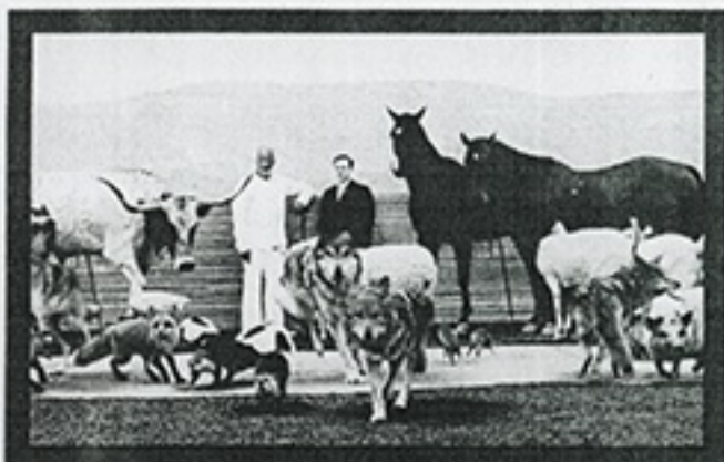
"Sigo como Dios" (agosto)

Siguiendo en nuestro continente, también