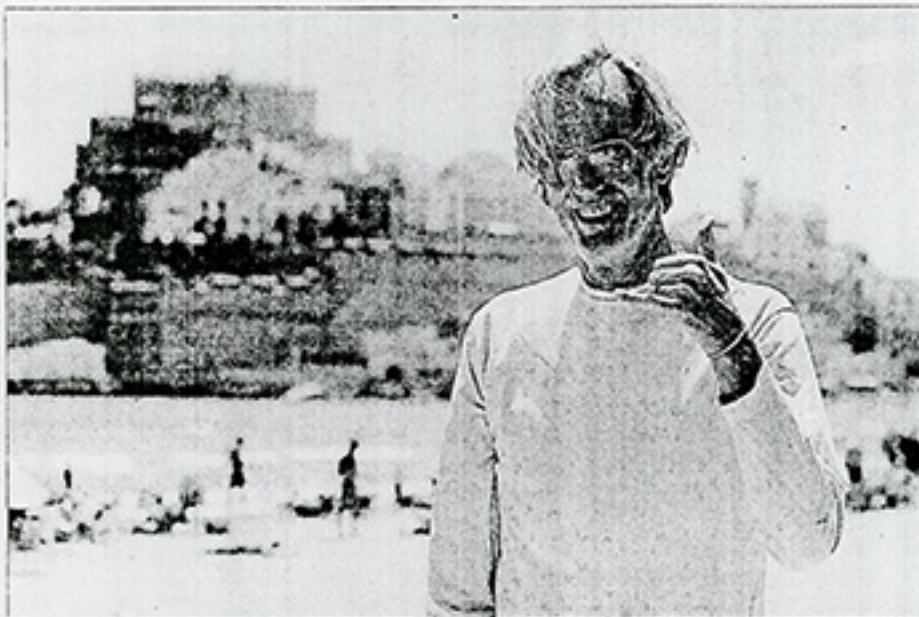
El actor Peter Fonda, a principios de junio en Pellicola.