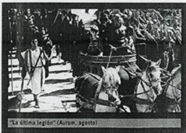
"La última legión" (Aurum, agosto)