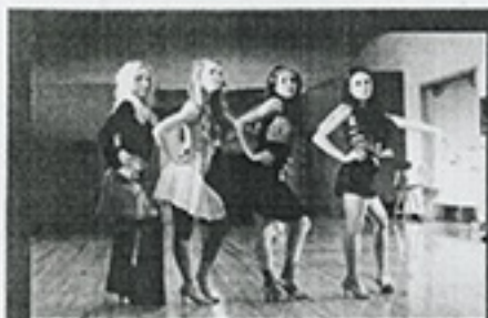
"Bratz" (Aurum, agosto)