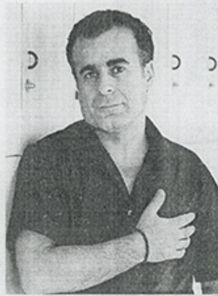
El director Bahman Ghobadi, en su reciente visita a Madrid

El director kurdo-iraní Bahman Ghobadi estrena «Media luna», un alegato en favor de la mujer y la libertad