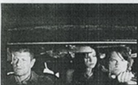
"Carretera al infierno" (agosto)