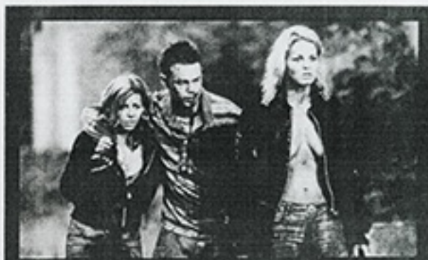
"Programa doble" (Manga Films, agosto)