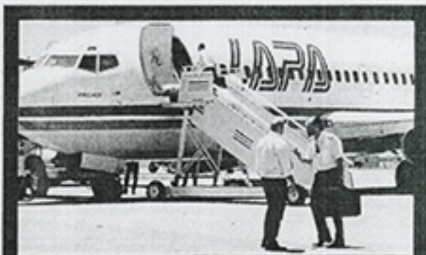
"Whisky Romeo Zulu" (Alta Films, agosto)