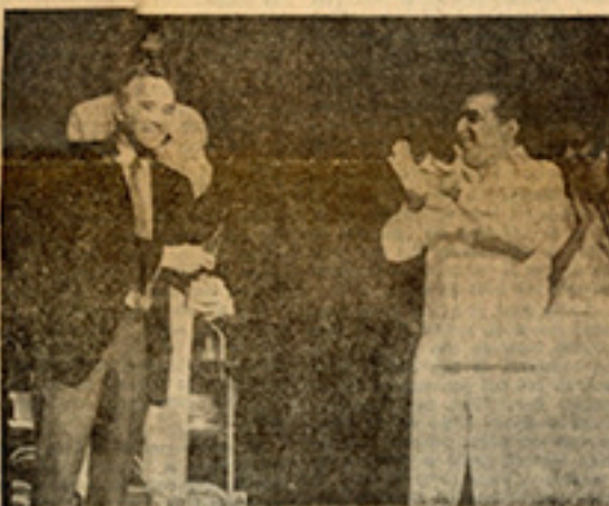
Un Coral especial le fue entregado por Gabriel García Márquez al actor norteamericano Jack Lemmon.