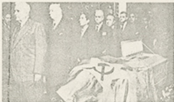
El general Heriberto Jara y Diego Rivera encabezan la guardia junto al féretro de Frida Kahlo, cobiertos por la bandera del Partido Comunista Mexicano.