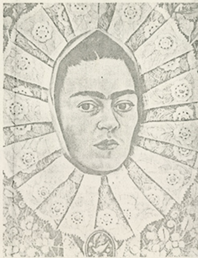
Auto-retrato (Oleo sobre masonite, 1938) Frida Kahlo