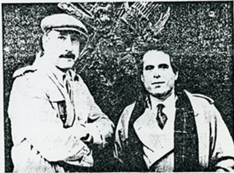
"CONDUCTA INAPROPIADA", una película de Nestor Almendros sobre la represión de los homosexuales y otras minorías en la Cuba de Castro. Jueves 3, 27, a las 9:30 de la noche en el Opera Plaza, 601 Van Ness Avenue, San Francisco.