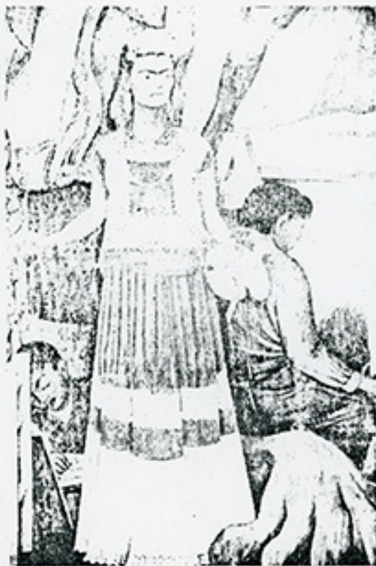
Frida Kahlo, por Diego Rivera. Detalle de un mural en el City College de San Francisco.