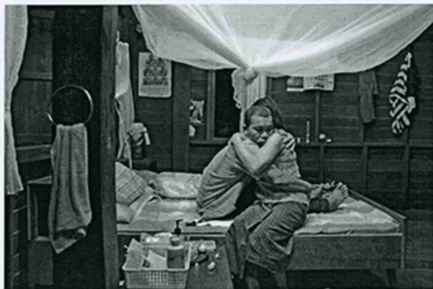
Uncle Boonmee Who Can Recall His Past Lives by Apichatpong Weerasethakul

Applications for distribution funding support can be submitted continually.