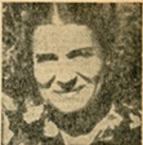
Unos meses antes de su muerte, a los 45 años de edad.