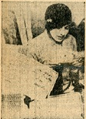
El asesino de Julio Antonio Mella es el presidente Gerardo Machado". La foto fue tomada a raíz de la caída del líder cubano.