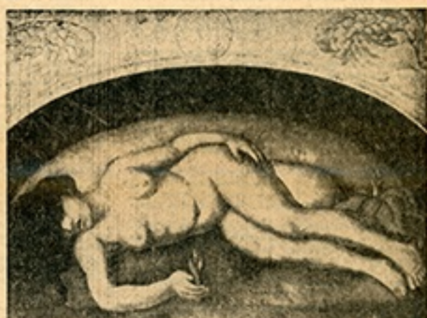
Diego Rivera la utilizó como modelo para representar la germinación, en un fresco en la capilla de San Francisco, en Chapingo.