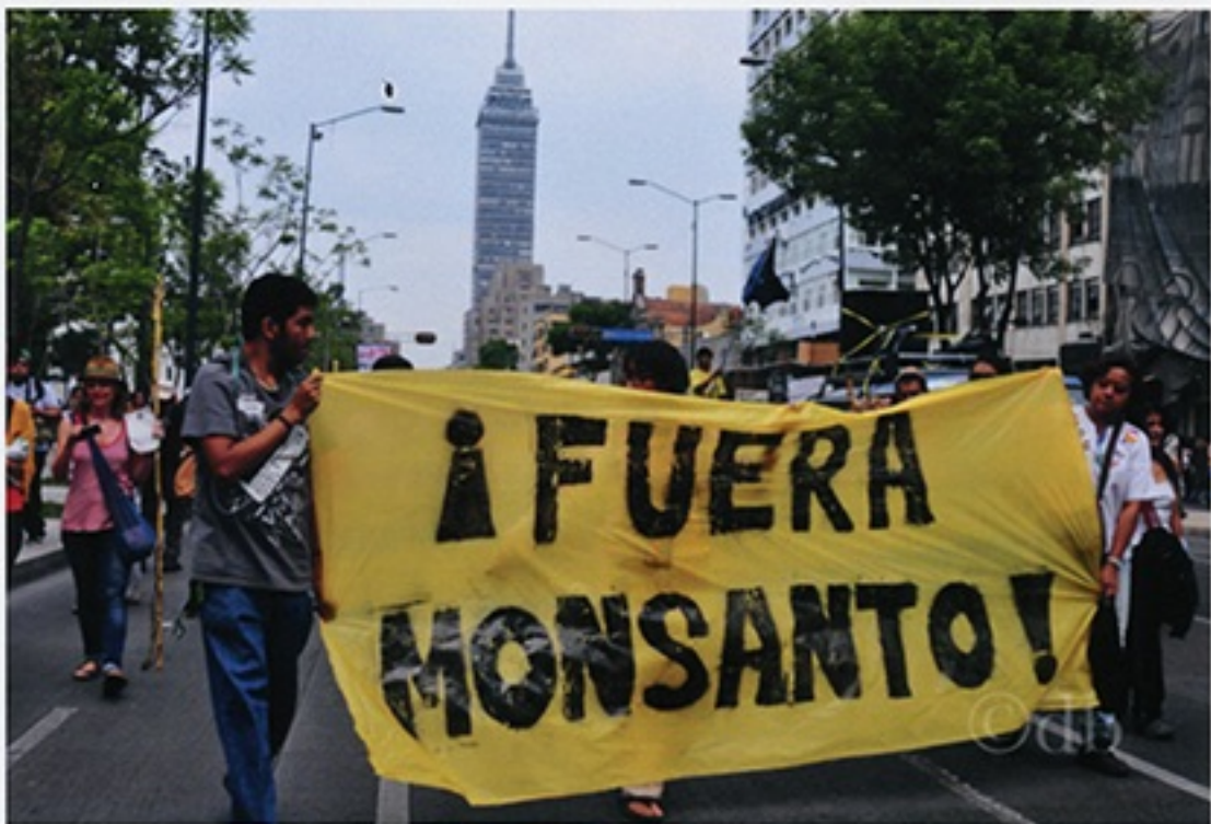
méxico vs monsanto