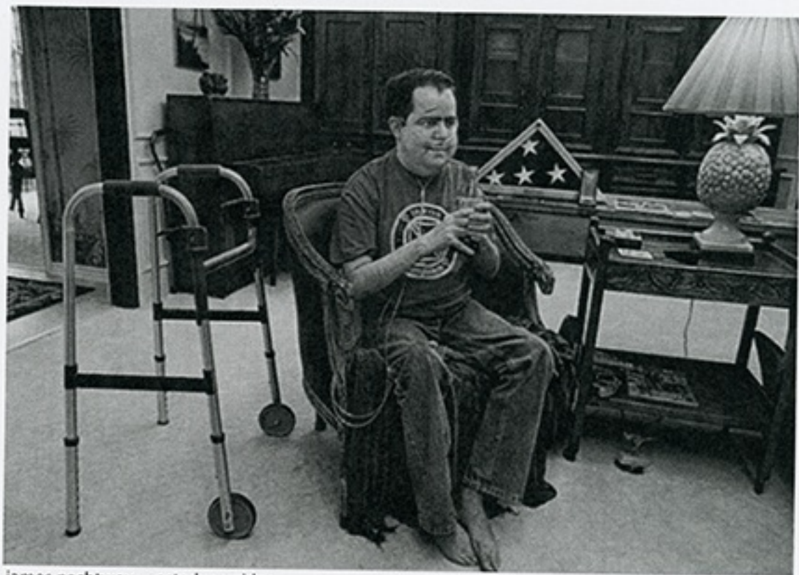
james nachtwey estados unidos