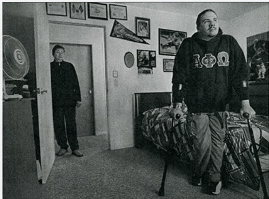
james nachtwey estados unidos