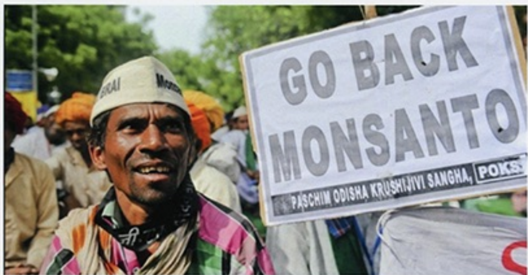
India vs monsanto