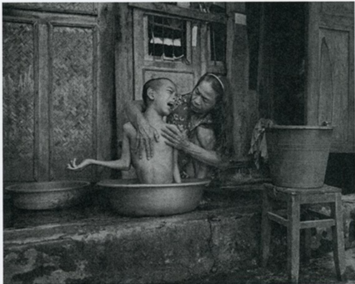
james nachtwey vietnam