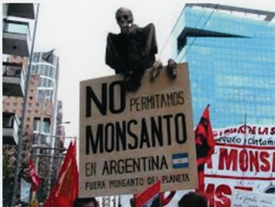
argentina vs monsanto