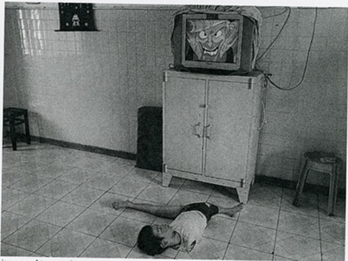
james nachtwey vietnam