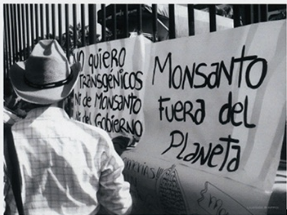
ecuador vs monsanto