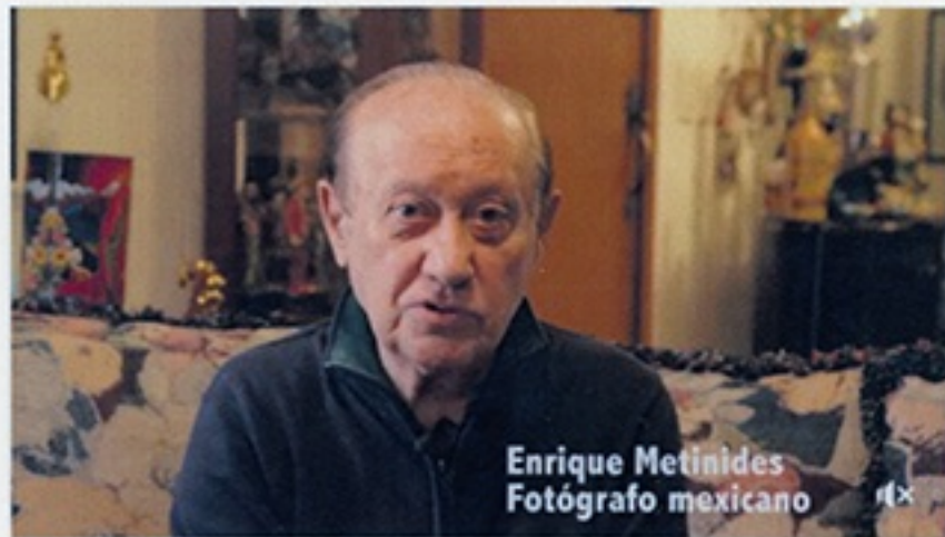
Enrique Metinides Fotógrafo mexicano

PRIMEROS AUXILIOS abre la invitación a participar en un evento colectivo y gratuito apoyado por profesionales que buscan sumar esfuerzos y compartir saberes sobre herramientas que contribuyan a la formación y e... Seguir leyendo