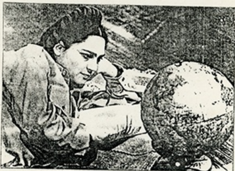
Ofelia Medina como Frida Kahlo.

El siguiente paso de Leduc lo llevó a enfrentarse nuevamente con una agencia estatal: al Consejo de Recursos para la Atención a la Juventud de México. Pero el producto final, ¿Cómo ves? , realizado para el Año Internacional de la Juventud y dedicado al FMI, demuestra una vez más su modernidad, la complejidad de su propuesta -que, al despistado, podrá parecerle inconclusa o incoherente- y confirma que Leduc probablemente es el cineasta latinoamericano activo más innovador del último decenio. En la actualidad, Paul Leduc es el presidente de la Fundación Mexicana de Cineastas.