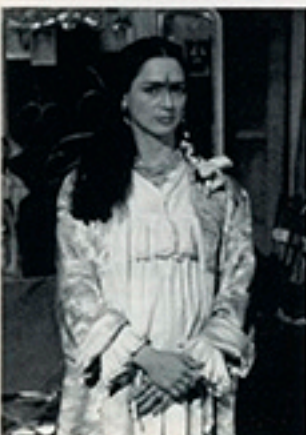
Frida (Frida, actualizada viva)

Vernissage Industrie/Industry de Richard Kerr