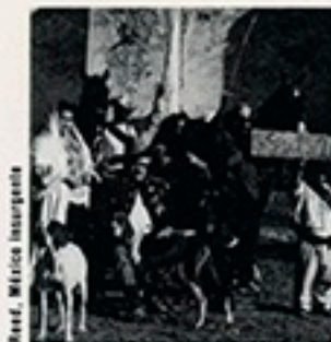
Réal. : Muriel Insurgente